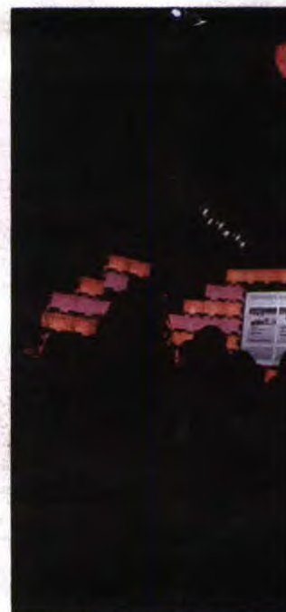
O evento Web Summit contribuiu para colocar P

Em 2016, o perfil dos serviços jurídicos mais representativos na