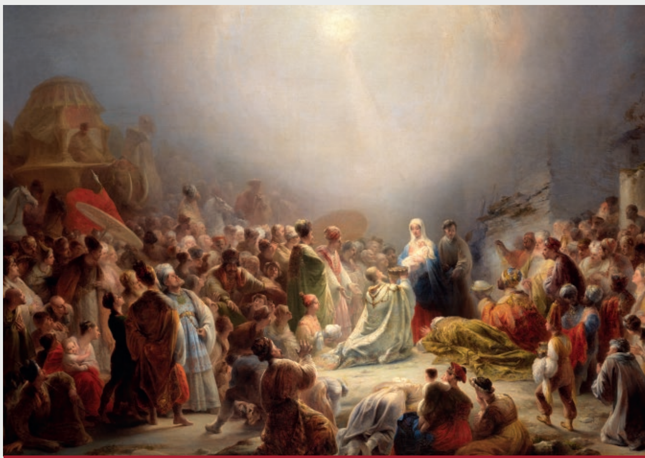
Domingos António Sequeira A Adoração dos Magos 1828 Óleo sobre tela 100 x 140 cm Coleção particular