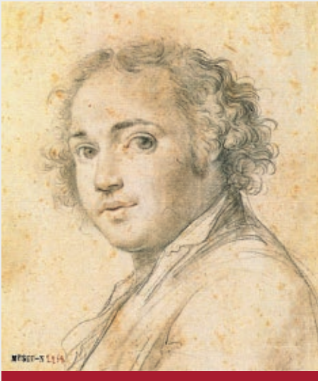
Domingos António Sequeira Autorretrato c. 1785 18,5 x 15,5 cm MNAA, Inv 2258 Des.