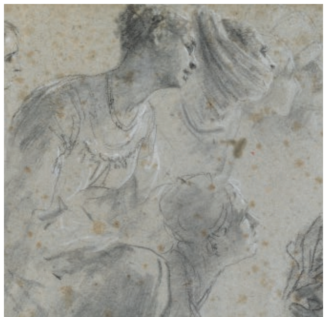
Domingos António Sequeira A Adoração dos Magos Desenhos preparatórios para estudo das personagens

Pela prodigiosa modelação das figuras e da luz, e pela estrutura da composição, “A Adoração dos Magos” é, como já em 1837 afirmava um académico romano, um absoluto capolavoro , uma obra-prima. Trata-se de uma obra visionária que evidencia uma marca essencial do estilo do pintor: a sua enorme capacidade de síntese entre o clássico e o romântico.