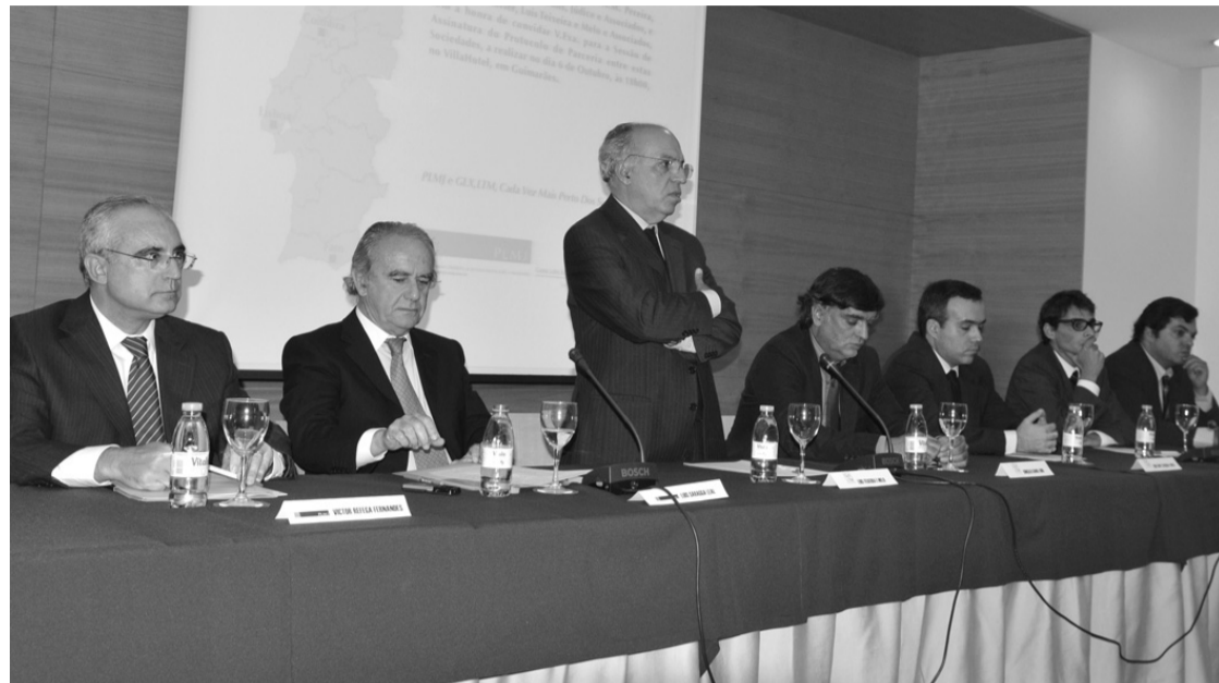
Parceria pioneira em Guimarães junta escritórios de advogados

São dois importantes escritórios de advogados de Lisboa e de Guimarães e juntaram-se numa parceria que pretende estender-se à Galiza num futuro próximo.