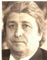
Procurador Geral da República

Num ano em que os mercados financeiros foram afectados pelo 'subprime', o Governo conseguiu superar os objectivos definidos para as privatizações. A última fase da EDP e a venda do capital da REN deram mais 340 milhões do que o Estado estava à espera. 2008 é, agora, a grande incógnita. A TAP promete ser a próxima na lista e até já constituiu um grupo de trabalho para estudar a saída do Estado de mais uma empresa. M.P.