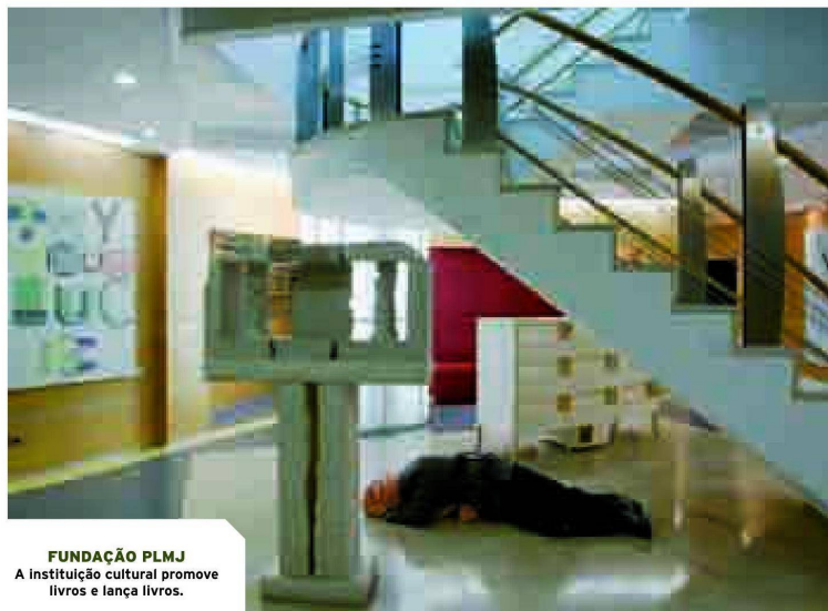
FUNDAÇÃO PLMJ A instituição cultural promove livros e lança livros.